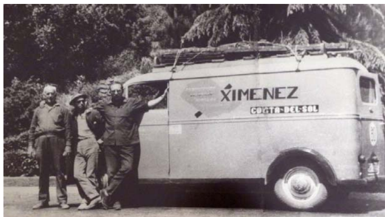
Figura 1. Furgoneta utilizada en los primeros años de la empresa